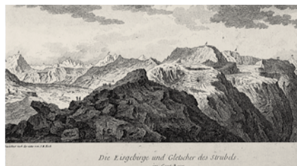
Joseph Anton Koch, Die Eisgebirge und Gletscher des Strubels , o.D., Kunstmuseum Thun

Sonntag, 10. April, 15.00 – 17.00 Uhr Mit gespitzten Ohren durch die Ausstel- lung: tröpfeln, plätschern, rauschen, sprudeln... Wie tönt die Skulptur? Wie klingt das Bild? Welche Geräusche macht die Installation? Töne und Klänge werden im Workshop zusammen mit dem Musiker Samuel Baur und der Kunstvermittlerin Rut Reinhard gesammelt, selber erzeugt und mit den Werken der Ausstellung in einen Dialog gestellt. Anmeldung erwünscht: T 033 225 84 20, kunstmuseum@thun.ch, CHF 5.–