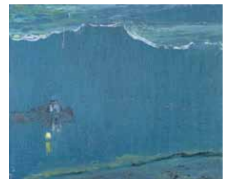
Viktor Surbek, Blauer Abend (Iseltwald) , 1973, Kunstmuseum Thun

Kreative Ausstellungsbesuche für jede Stufe nach Vereinbarung. Dauer: 2 Lektionen. Information / Anmeldung: T 033 225 84 20, kunstvermittlung@thun.ch Dokumentation auf Webseite